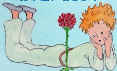
イラスト 『星の王子様』より